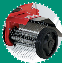
AÉRATEUR à ressorts, 50 cm