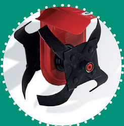
RÉDUCTION FRAISE largeur de travail 16 cm