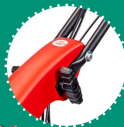
GUIDON réglable verticalement