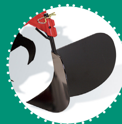
BUTTEUR à ailes fixes