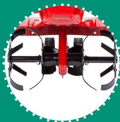
FRAISE couteaux rivetés Ø26 cm 40 cm