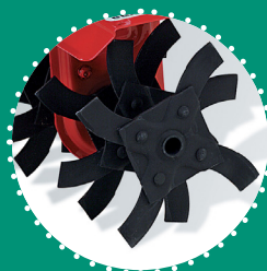
SCARIFICATEUR à lames, 30 cm