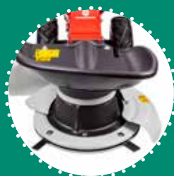
FALCE ROTANTE a 4 coltelli in acciaio rientranti larghezza taglio 57 cm