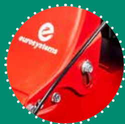
MANUBRIO registrabile verticalmente