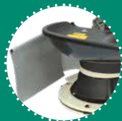
KIT RANGHINA bandella con telo laterale per creazione andana