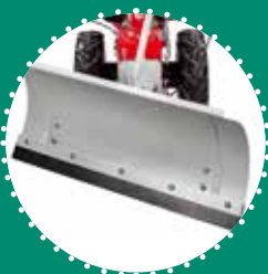
LAMA NEVE 85 cm orientabile \pm 30^\circ