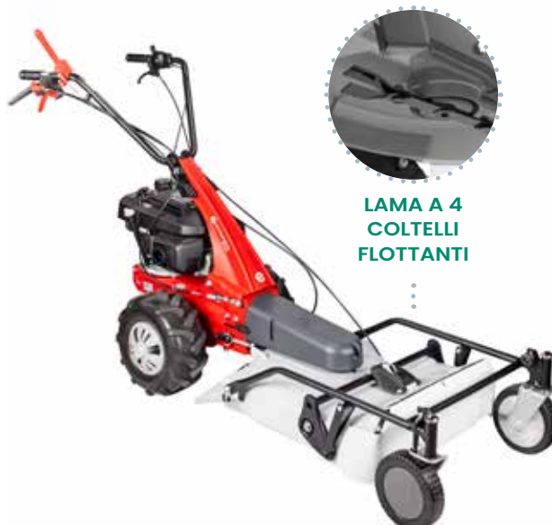
LAMA A 4 COLTELLI FLOTTANTI