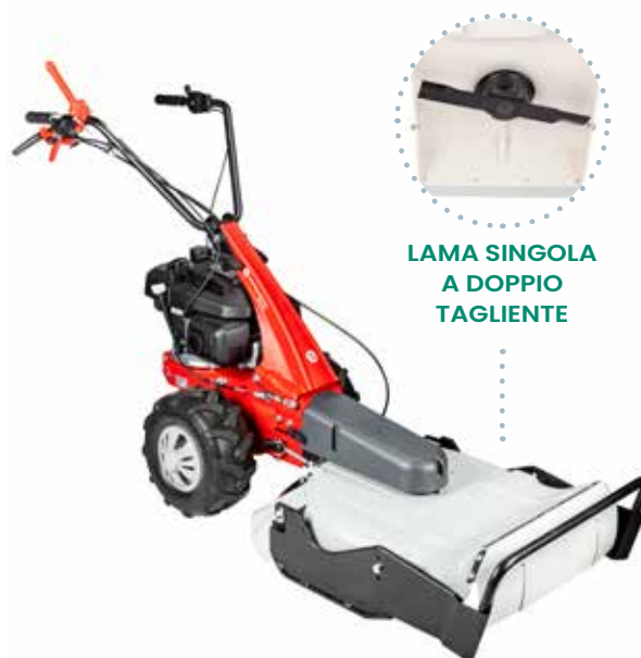
LAMA SINGOLA A DOPPIO TAGLIANTE