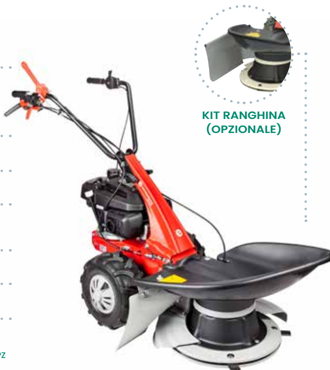
KIT RANGHINA (OPZIONALE)