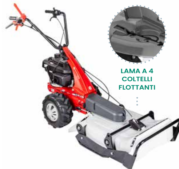
LAMA A 4 COLTELLI FLOTTANTI