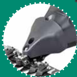
COFANO SPARGI ERBA oscillante, brevettato