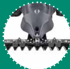
MOVIMENTO MONOLAMA due lame di cui superiore oscillante, taglio 87 cm