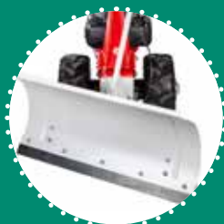
LAMA NEVE 85 cm orientabile \pm 30^\circ