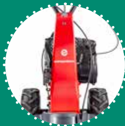
MANUBRIO REGISTRABILE verticalmente