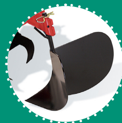
BUTTEUR à ailes fixes