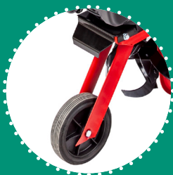
ROUE de transport avant amovible