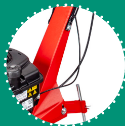
GUIDON réglable verticalement