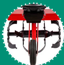
FRAISE couteaux rivetés Ø26 cm 36 cm