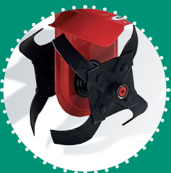
RÉDUCTION FRAISE largeur de travail 16 cm