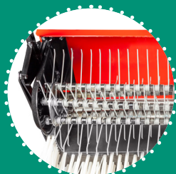
ROTOR À RESSORTS activation indépendante 80 cm - 142 tr/min