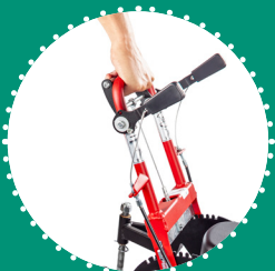
LEVIER D'ENGAGEMENT DU ROTOR avec gestion des niveaux de profondeur de travail