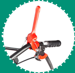
LEVIER D'ENGAGEMENT DE L'OUTIL à pression en tôle avec système de sécurité intégré