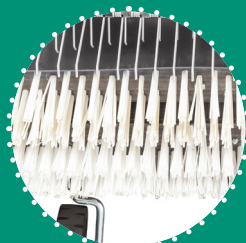
BROSSES (x2) dont avant oscillante avec engagement indépendant et commandes de réglage de la profondeur de travail