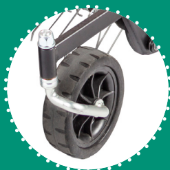
ROUES PIVOTANTES (x4) avec butée limiteur pour le transport